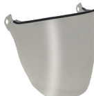
WVI00003-520 FULL FACE VISOR SILVER MIRROR