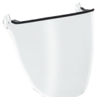
WVI00003-500 FULL FACE VISOR CLEAR