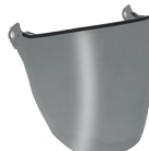
WVI00003-510 FULL FACE VISOR SMOKE