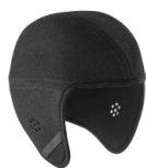
WPA00007 WINTER CAP