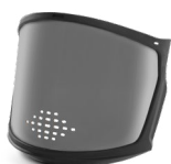
WV100008 VISIERA FULL FACE