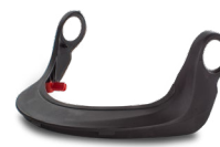
WAC00010 SUPPORTO VISIERA A RETE