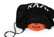
WAC00026 SACCA PORTACASCO