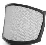
WV100009/10 VISIERA A RETE ZEN